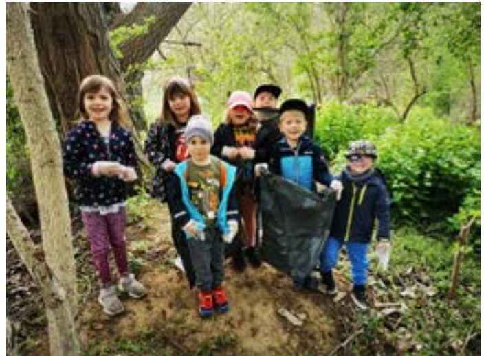
Die Kinder und Erzieherinnen der Kita „Bebraspatzen“