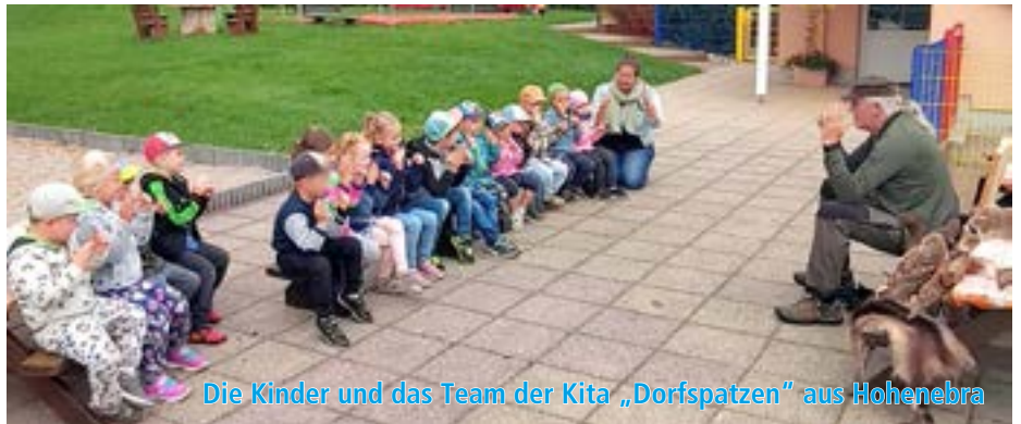
Die Kinder und das Team der Kita „Dorfspatzen“ aus Hohenebra

Waldtraut und Hainer – das lustige Specht-Ehepaar besuchte mit ihrer Freundin Betty Fledermaus (Handpuppen) und Förster Hubert die „Dorfspatzen“. Gemeinsam erklärten sie den Großen und Kleinen, warum der Specht eines der wichtigsten Tiere des Waldes ist. Interessiert lauschten die Kinder den spannenden Geschichten vom Förster und waren fasziniert von den ausgestopften Tieren, die Herr Hubert mitgebracht hat. Auch neue Spielideen brachte der Förster mit, die natürlich gleich gemeinsam ausprobiert wurden. Vielen Dank für dieses tolle Erlebnis!