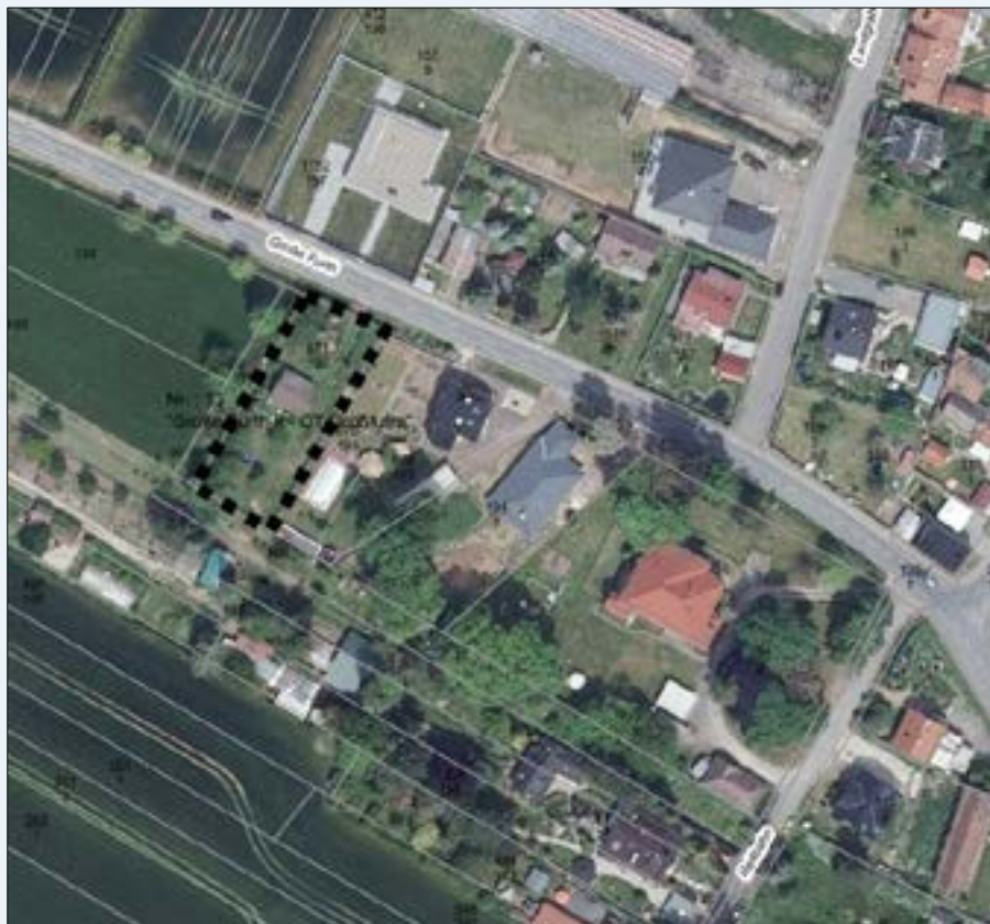
Darstellungen ohne Maßstab