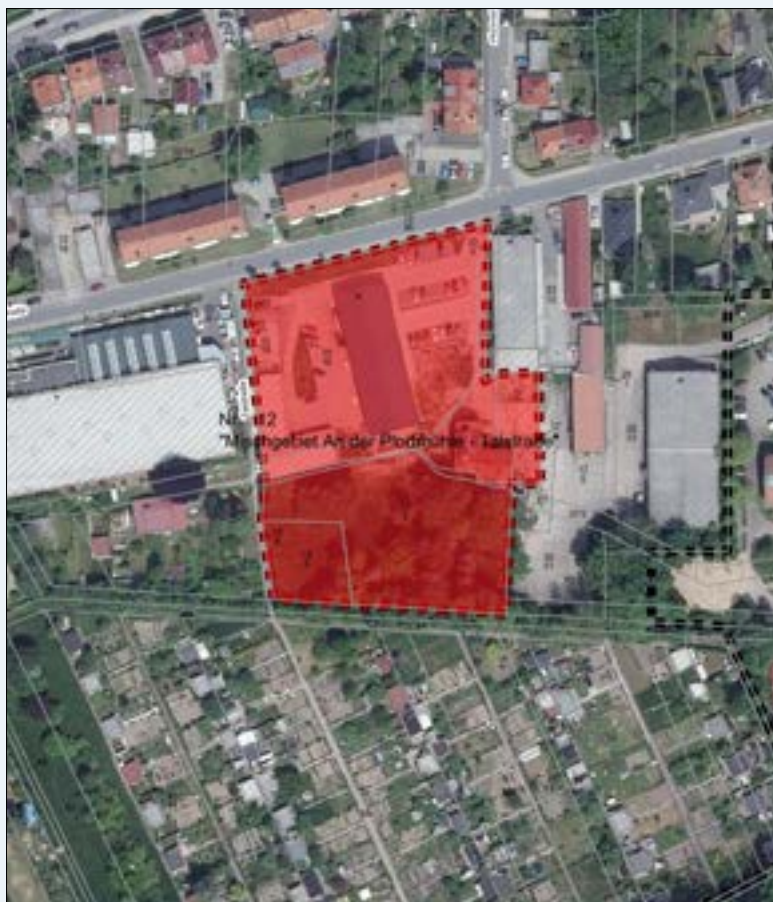
Lage des Plangebietes und räumlicher Geltungsbereich (ohne Maßstab)