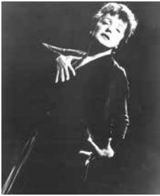
Édith Piaf

Das Leben der französischen Chansoniere Édith Piaf war so reich, dass es für etliche Theaterstücke ausreichend Stoff bieten würde. Das Theater Nordhausen bringt in der neuen Revue „Édith Piaf“ von Anette Leistenschneider die Geschichte einer der faszinierendsten Frauen und Künstlerpersönlichkeiten des 20. Jahrhunderts auf die Bühne. Am 18. September erlebte die Revue ihre Uraufführung und steht weiter auf dem Spielplan des Theaters.