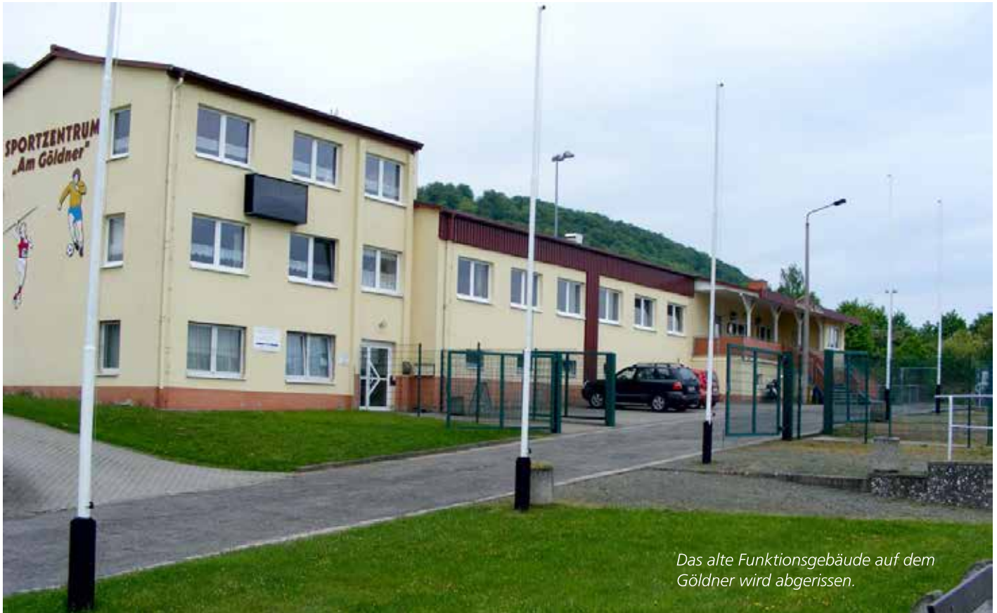
Das alte Funktionsgebäude auf dem Göldner wird abgerissen.

Nach den jüngsten öffentlichen Diskussionen um den Abriss des alten Funktionsgebäudes im Sportzentrum „Am Göldner“ in Sondershausen räumte der Sondershäuser Stadtrat am 21. Januar dem Hauptnutzer der Anlage, BSV Eintracht Sondershausen, die Möglichkeit ein, innerhalb von drei Wochen ein nachhaltiges Konzept zur zwingend vollumfänglichen Finanzierung, Unterhaltung und Nutzung des Mehr-