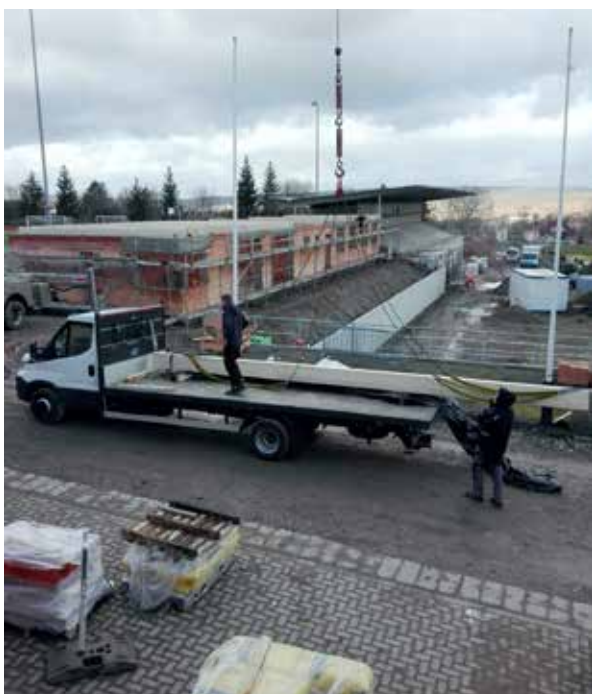
Die Arbeiten am Ersatzneubau sind derzeit in vollem Gange und liegen im Zeitplan.

Einigkeit herrschte darüber, auch in Zukunft weiterhin im offenen Gespräch zu bleiben und für die Zukunft stets tragfähige und gemeinsame Lösungen zu finden. Dies betrifft insbesondere die nach dem Rückbau entstehende Freifläche. Hierzu sind grundsätzlich viele Varianten der Nutzung vorstellbar.