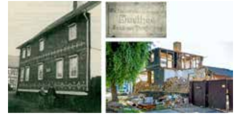
Abbildung Göthe-Stammhaus in Berka, die Erinnerungstafel und der Abriss 2019

verschiedene Familien, auch wenn sie miteinander verwandt waren, und alle konnten nicht im hier bekannten Goethe-Stammhaus in der heutigen Goethe-Straße 11 gewohnt haben.