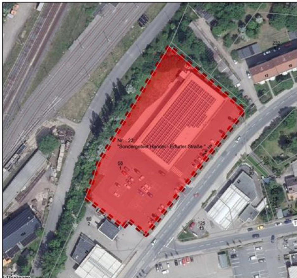
Darstellungen ohne Maßstab