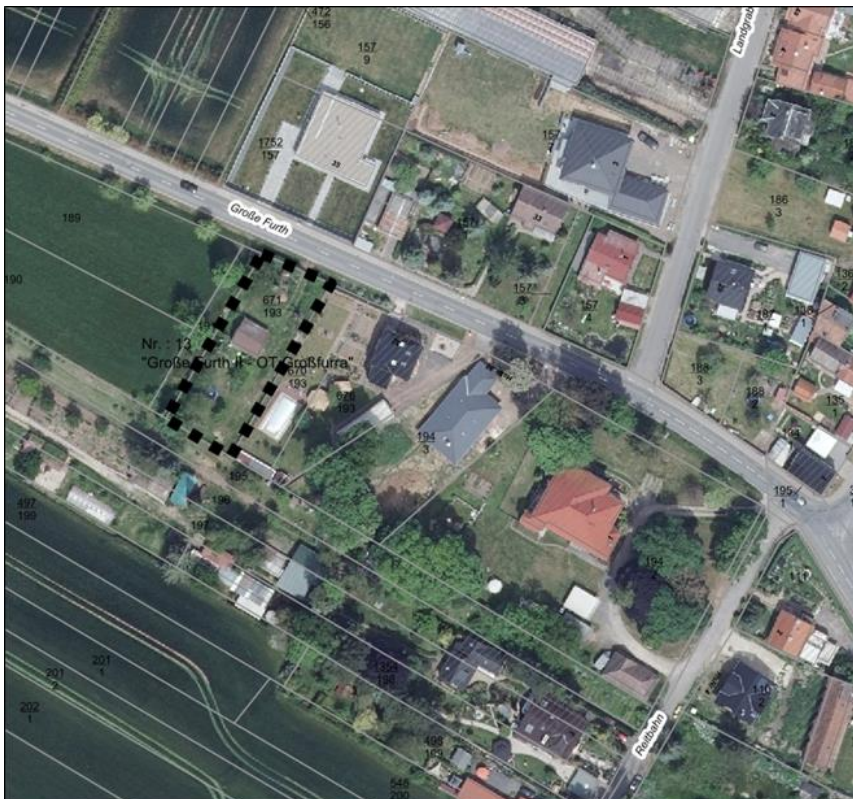
Darstellung ohne Maßstab