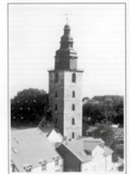
GLOCKEN- PROJEKT ST. TRINITATIS SONDERSHAUSEN

Bitte Code beachten: RT 2986/Spende Glockenprojekt St. Trinitatis Sondershausen