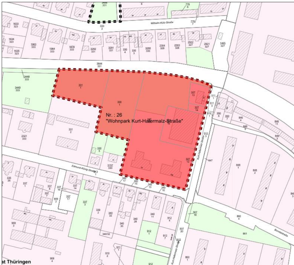
Räumlicher Geltungsbereich (ohne Maßstab)